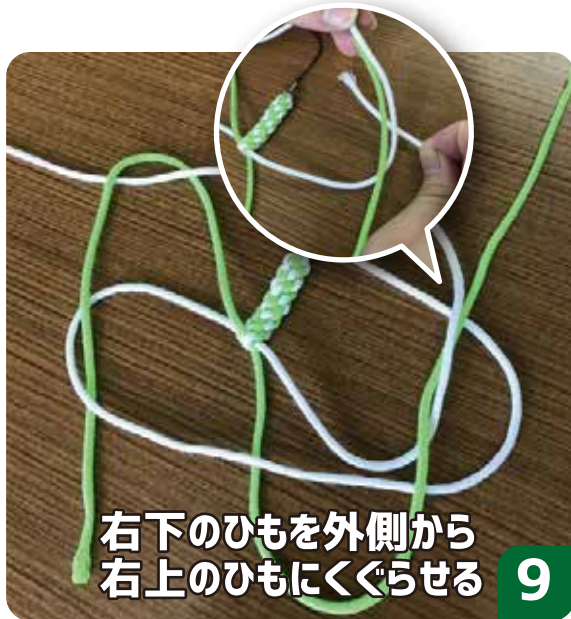
右下のひもを外側から 右上のひもにくぐらせる 9

ちょうどいい大きさにになったら ほどけないように玉どめ！ ←のように、6の「田」までは一緒だぞ