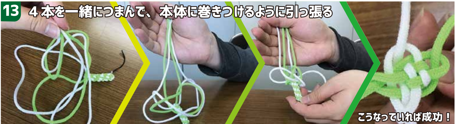
13 4本を一緒につまんで、本体に巻きつけるように引っ張る

さっきの「し」「つ」「N」「田」と 同じやり方でもう一周すると思うとわかりやすいよ