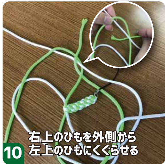
右上のひもを外側から 左上のひもにくぐらせる 10