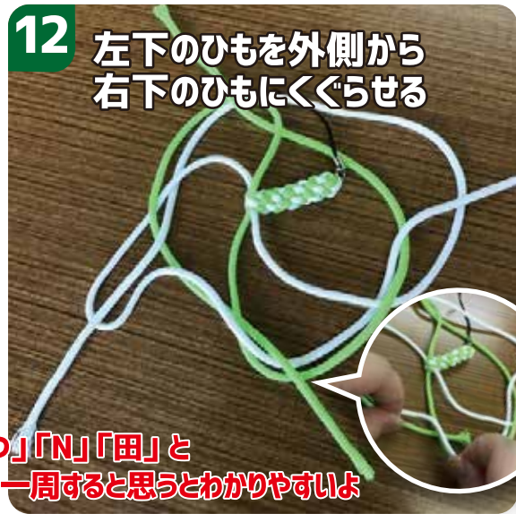
左下のひもを外側から 右下のひもにくぐらせる 12