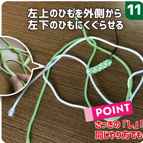
左上のひもを外側から 左下のひもにくぐらせる 11